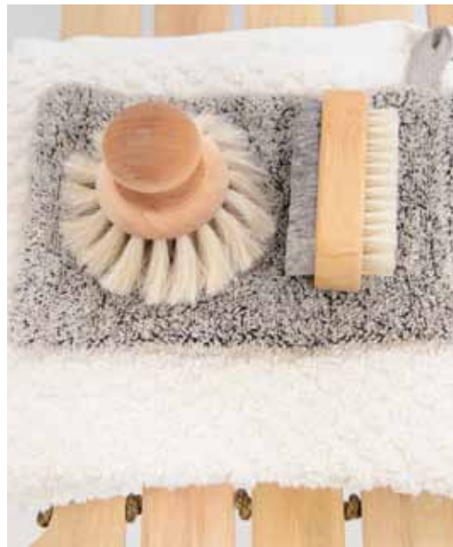
FÖR REKREATION. Stiftsgården, som drivs kommersiellt, ska utökas med allehanda innehåll för ett spa.